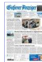
Die heutige Ausgabe des Gießener-Anzeiger